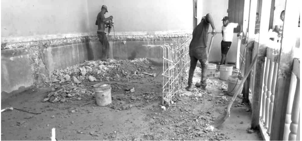
L'auditoire de l'école de La Savane a dû être démolie à la suite de dégâts causés à sa structure par le déversement du réservoir d'eau qui a cédé lors du séisme.

L'école de la Savane a quant à elle subi une inondation à la suite d'une rupture des tuyaux, causant la démolition d'un auditoire par mesure de sécurité. La cour de l'école nécessite des travaux car elle présente un sol irrégulier, gonflé par l'eau qui s'y est infiltrée.