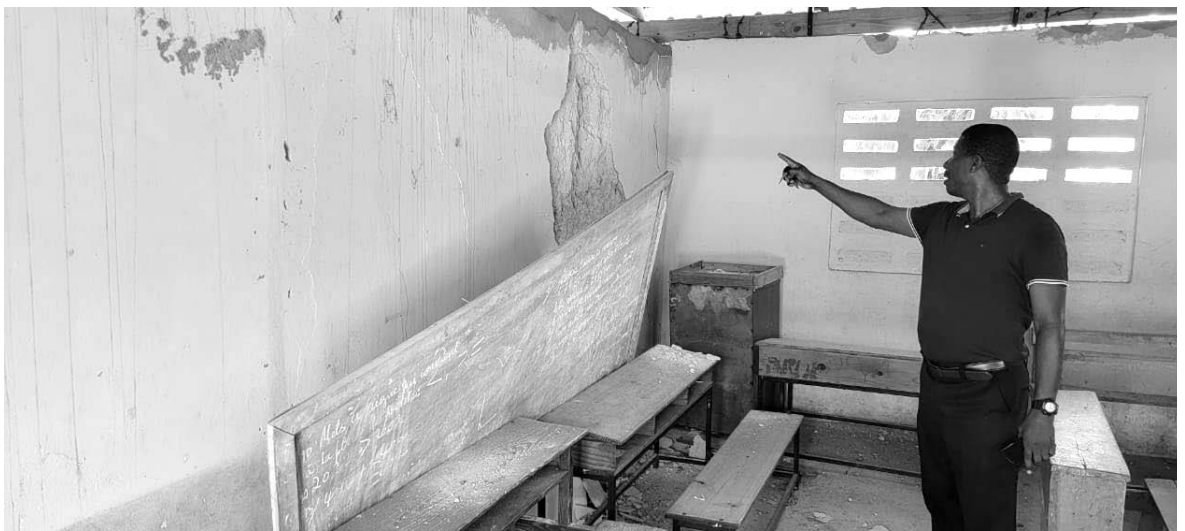
Le Père Percy indique les dégâts des salles de classe de l'école de Dory dont les murs sont profondément fissurés, ou totalement tombés

À Dory, le Père Percy nous a informés que 85% de la population de ce village se retrouvent sans logement. Plus de 10 vies ont été perdues dans cette localité. L'église dont le Père Percy est en charge s'est écroulée, tandis que le presbytère où il résidait ne présente plus que quelques murs. Les classes de l'école fondamentale des Mains Ouvertes montrent de grandes fissures sur les murs, lorsque ceux-ci tiennent encore debout. Les habitants de cette commune rurale sont logés à la belle étoile depuis quatre semaines.