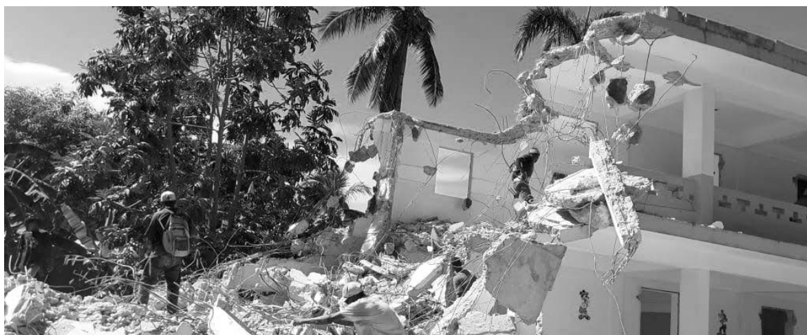
Démolition du centre professionnel hôtelier des Deux Mapous.