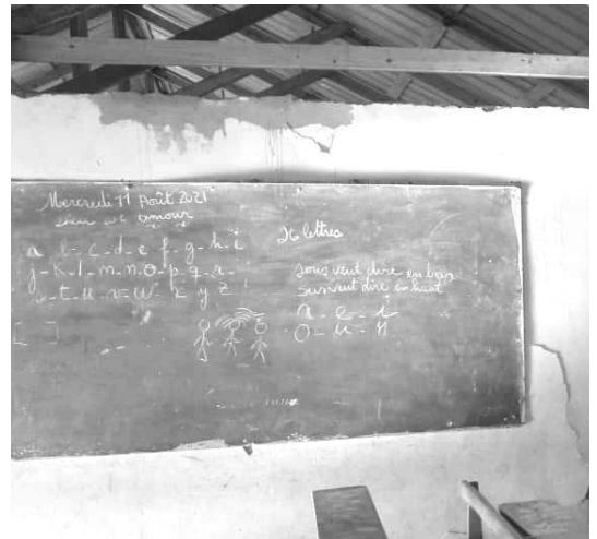
Journal réalisé par Andreia Dos SANTOS et Laurence ROUSSEL